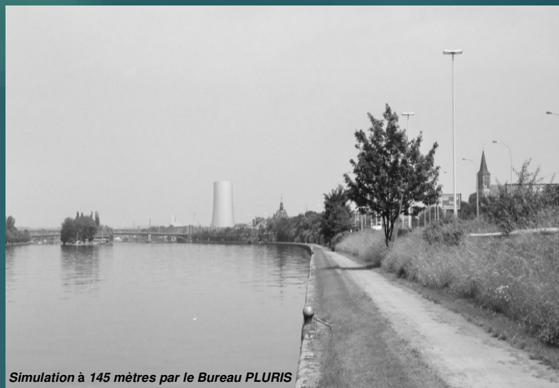
Simulation à 145 mètres par le Bureau PLURIS

La plupart des acteurs politiques et publics locaux se sont prononcés à l'encontre du projet. Estimant, notamment, que l'implémentation d'une telle structure industrielle à quelques encablures du centre ville pourrait déséquilibrer la stratégie de développement socio-économique et touristique de la Ville de l'Oie, mais aussi de la Basse-Meuse dans une certaine mesure. D'autres voix se font entendre quant à l'impact environnemental du projet.